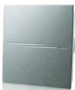
Квайт-Стайл А (з декоративною накладкою з алюмінію)